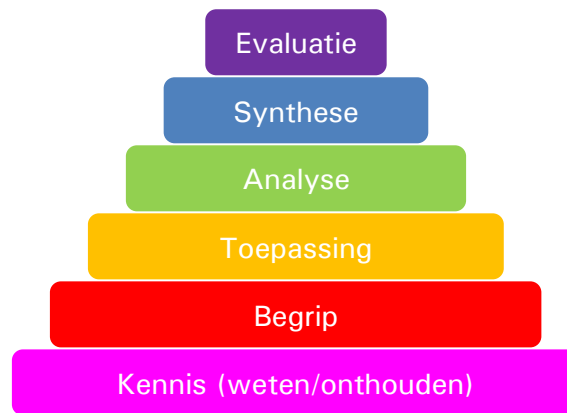
Taxonomie van Bloom

Aan de basis van de formulering van de toetstermen in dit document ligt de taxonomie van Bloom. Dit is een indeling in zes beheersingsniveaus, die verwijzen naar de verschillende denkprocessen. De benodigde denkprocessen onderin de piramide zijn eenvoudiger van aard dan de processen bovenin de piramide.